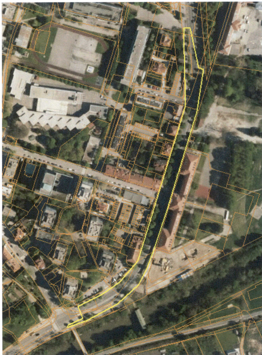
Karta1: Predlagana sprememba območja naravne vrednote z ident. št. 7794

V obdobju po izdaji zgoraj navedenih konkretnih smernic je naslovni zavod na pristojno ministrstvo posredoval zadnjo verzijo strokovnega predloga sprememb podatkov naravnih vrednot za spremembo Pravilnika o določitvi in varstvu naravnih vrednot (dopis št. 3560-0007/2022-3 z dne 5. 12. 2022). V strokovni predlog sprememb je vključena tudi naravna vrednota z ident. št. 7794 in imenom Ljubljana – drevored cibor in lip ob Roški cesti. Na podlagi natančnejše terenske preveritve je za omenjeno naravno vrednoto predlagana sprememba atributnih podatkov (popravek imena v Ljubljana – dvostranski drevored lip ob Roški cesti) in grafičnih podatkov (povečanje naravne vrednote, tako da zajema celotni drevored na obeh straneh Roške ceste). Predlagana sprememba območja naravne vrednote je z rumeno barvo prikazana na karti 1.